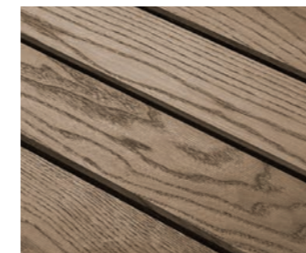
Natürlicher Farbton behandelter Klickfliesen

Nun kann das Öl gleichmäßig aufgetragen werden. Hier eignet sich ein handelsübliches Pflegeöl für Holz. Wir empfehlen jedoch ein Öl mit hohem UV-Schutz zu verwenden. Durch das Öl werden die Poren verschlossen und Verschmutzungen können sich nicht mehr so einfach festsetzen. Das erleichtert die Reinigung im Nachhinein.