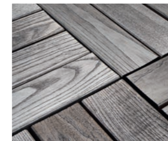
Natürlicher Farbton nach einigen Monaten ohne Behandlung