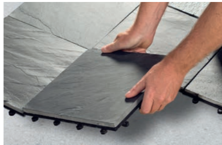
Schnell & einfach auf- und abbauen