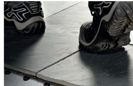
Sofort begeh- und belastbar