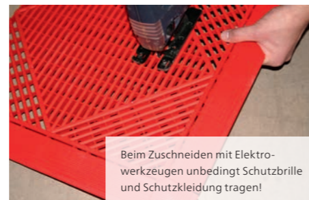
Falls nötig zuschneiden

Beim Zuschneiden mit Elektrowerkzeugen unbedingt Schutzbrille und Schutzkleidung tragen!