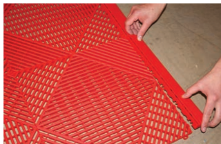
Seiten- und Eckteile anbringen